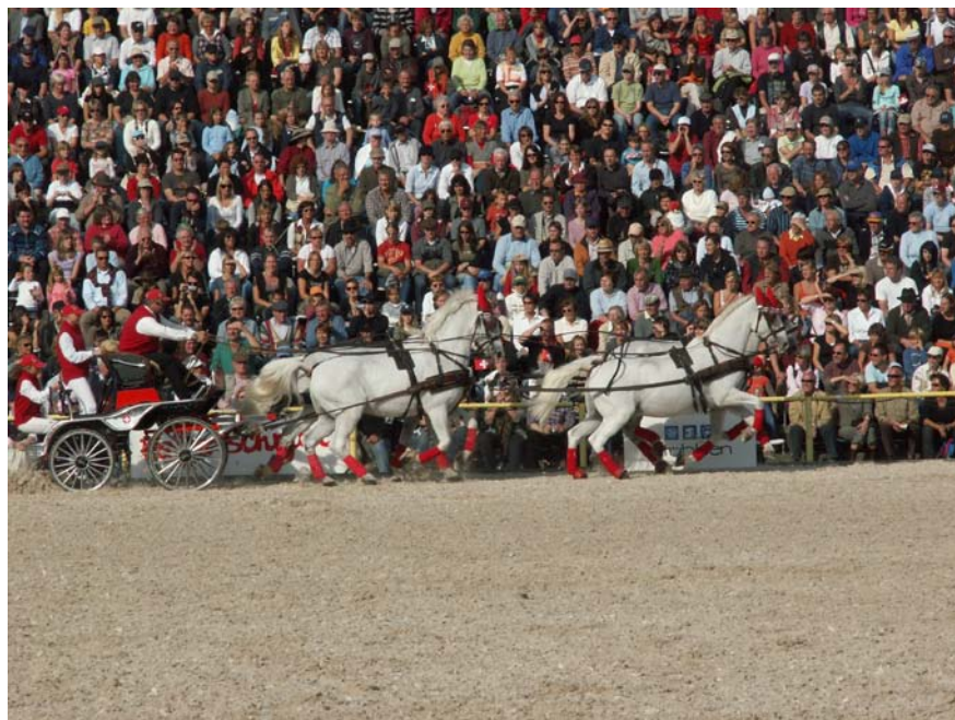
Slika 13: Lipicanec v četverovpregi s tremi kladrubskimi žrebci na paradi žrebcev (Hengstparade) v najstarejši nemški kobilarni Marbach leta 2008