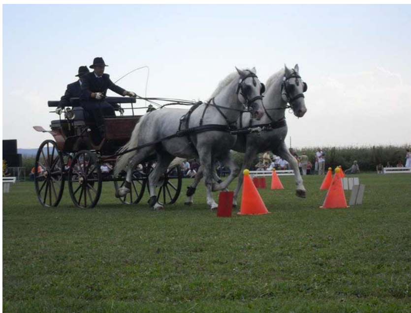
Slika 11: Zbranost in točnost pri tekmovanju s stožci

V žargonu jo imenujejo kar stožci. Tekmovanje se odvija na ravni peščeni ali travnati podlagi. Proga je označena s stožci na katerih so žogice (slika 11). Progo morajo tekmovalci prevoziti po začrtani poti in čim hitreje, brez podrtih stožcev oziroma padlih žogic. Tu se izkaže poslušnost, vodljivost, zbranost in pripravljenost konj za delo po napornem maratonu, saj je ta del tekmovanja po navadi na vrsti zadnji tekmovalni dan. Od voznika zahteva precizno oko in natančno izpeljano progo. Kazenske točke lahko tekmovalec dobi, če štarta pred sodniškim zvoncem ali pa 60 sekund po njem, če v roki ne drži biča, če poruši žogice ali stožce, v primeru neposlušnosti konj, sestopa voznika ali sovoznika in v primeru prekoračitve dovoljenega časa. V primeru, da se voz prevrne, je prekoračen maksimalen čas, po tretji neposlušnosti konj ali prehoda preko ovire, ki ni v vrstnem redu pa sledi izključitev (Rules for ..., 2011).