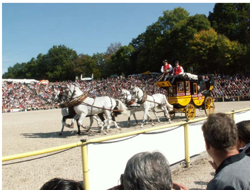
Slika 14: Poštna kočija na paradi žrebcev v Marbachu

Konji lipicanske pasme se pojavljajo po vsem svetu. Najbolj pa so razširjeni v Evropi. Odvisno je tudi iz katere kobilarne oziroma reje prihaja konj in kakšen je njegov rodovnik. Na ceno lahko vplivajo tudi predniki konja. Največjo težo pa ima prav gotovo znanje in sama delovna sposobnost konja. Torej je pomembna udeležba na tekmovanjih ali na predstavah. S tem se povečuje prepoznavnost posameznega konja in zanimanje za pasmo. Lipicanski konji so nastopili na največjem sejmu na svetu, na Equitani leta 2007. Sejem obiščejo tekmovalci, rejci, organizatorji tekmovanj, proizvajalci opreme, krme, transportnih sredstev, ljubitelji konj, skratka vsi, ki jih konjenišvo kakor koli povezuje. V letu 2007 so zabeležili okoli 220 000 obiskovalcev. Nastopati na tako velikem sejmu ima velik pomen za predstavitev pasme, saj si predstavo ogleda veliko število ljudi. Kobilarna Marbach ima žrebce različnih pasem, med njimi tudi enega lipicanskega. Tja vozijo pripuščati kobile rejci iz deleže Baden-Württemberg. Vsako leto organizirajo parado žrebcev (Hengstparade) v zadnjih dneh oktobra in prvih dneh novembra (tri do štiri ponovitve), ki se je udeleži vsako leto 40.000 do 50.000 gledalcev (sliki 13 in 14).