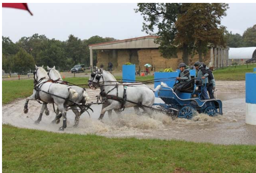
Slika 10: Tekmovalec v maratonski vožnji

To je za gledalce najbolj zanimiva predstava. Maraton je lahko dolg do 18 km. Med progo tekmovalci premagujejo različne ovire, strme vzpone, nagibe in ostre zavoje. Ovire so lahko naravne ali narejene iz primernih materialov, vendar jih organizatorji poskušajo čim bolj približati naravnim. Tu se pokaže moč in kondicijska pripravljenost konj. To je fizično najbolj zahtevna disciplina za konje v vpregi. Med samim tekmovanjem je veterinarska kontrola konj. Napake pri maratonu so nepravilen hod v določeni fazi, sestop sovoznika in voznika med vožnjo, prihod v cilj pred minimalnim ali dovoljenim časom, narobe izpeljana pot okoli ovire, če je tekmovalec brez biča. Napake, ki so vzrok za izključitev, so kas ali galop v fazi, ki je namenjena koraku, prihod v cilj po maksimalnem času, prelahek ali preozek voz, opešanos konj med samim tekmovanjem, nepravilen vstop v tekmovalni prostor in nedovoljena zunanja pomoč. Zmaga tista ekipa, ki najhitreje in z najmanj napak premaga progo (Rules for ..., 2011).