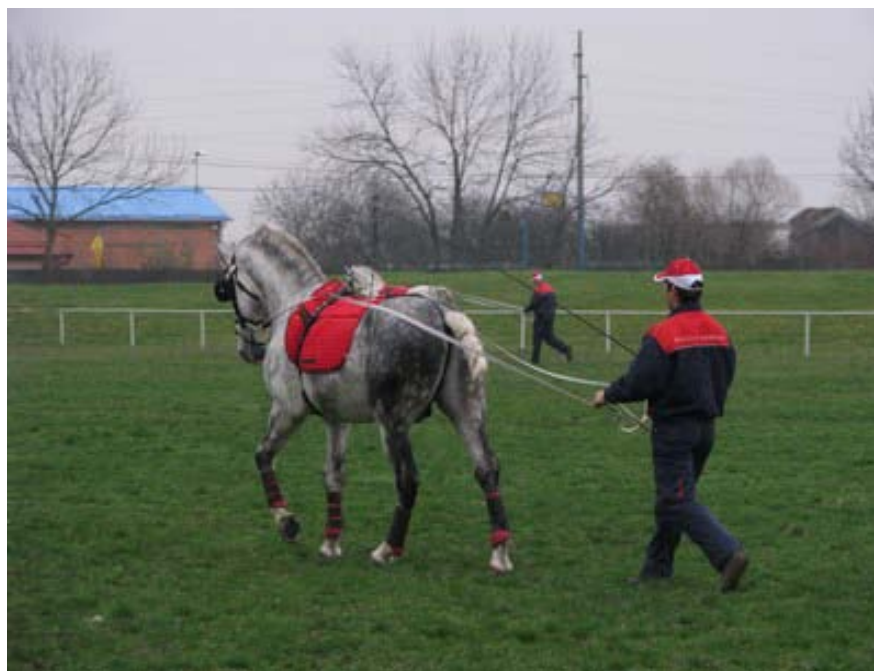
Slika 8: Lipicanec v treningu za vožnjo (Uzgoj ..., 2011)