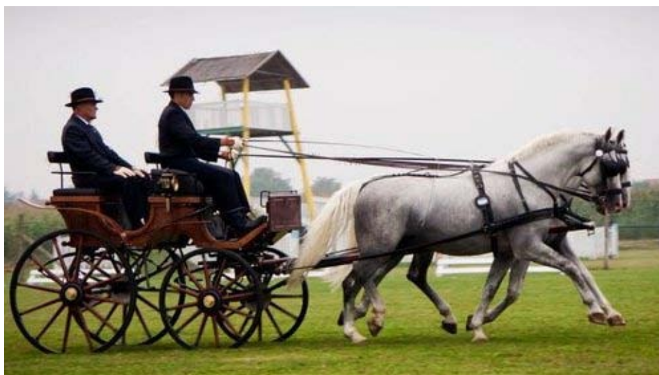
Slika 9: Dresurna vožnja

V prostoru v izmeri najmanj 100 m x 40 m voznik vodi konja oziroma konje po točno določenih navodilih in izvaja like kot so krogi, pol krogi, serpentine, diagonale. Med tem menja tudi tempo in korake. Nalogo mora izpeljati čim bolj natančno in brez napak ter v določenem času. Vsako napako v nalogi in prekoračen čas kaznujejo s kazenskimi točkami. Točkujejo tudi skladnost konja oziroma konj z voznikom. Voznikova dejstva morajo biti čim bolj neopazna. Celotna naloga mora biti čim bolj mirno izpeljana. S tem dobi voznik več točk in večji odstotek ocenjenosti izvedene naloge. Kot napake štejejo prezgoden oziroma prepozen vhod v tekmovalni prostor, sestop voznika ali sovoznika s kočije, napaka pri sami izvedbi naloge. V primeru, da se prevrne kočija ali zašepa konj, sledi izključitev. Tekmovalci in konji morajo imeti predpisano opremo sicer sledijo kazenske točke. Voznik mora imeti predpasnik, rokavice, pokrivalo in bič. Prav tako mora imeti ustrezno obleko sovoznik. Zmaga tisti voznik oziroma ekipa, ki je nalogo opravila najbolj skladno in z najmanj napakami. Rezultate dresure, maraton in spretnostne vožnje seštevajo in po končanem tekmovanju razglasijo končni rezultat (Rules for ..., 2011). Na sliki 9 je prikazana dresurna vožnja.