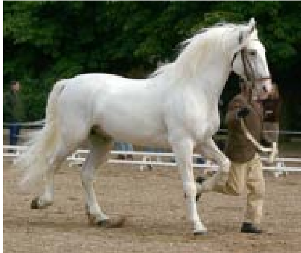
Slika 2: Kladrubški konj (Kladruby ..., 2006)