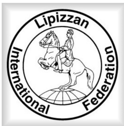
Slika 6: Logotip mednarodne organizacije rejcev lipicanskih konj (Conditions ..., 2001)

Leta 1986 je bila v Lipici ustanovljena mednarodna organizacija rejcev lipicanskih konj – Lipizzan International Federation (logotip predstavlja slika 6), katera ima namen zagotoviti obstanek ogrožene pasme lipicancev. Vpisani v rodovno knjigo so lahko le tisti lipicanci, ki izvirajo direktno iz ene od osmih linij lipicanca (Conversano, Favory, Incitato, Maestoso, Neapolitano, Pluto, Siglavy, Tulipan) in kobil, ki izhajajo iz tradicionalne reje