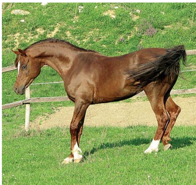
Slika 3: Arabski konj