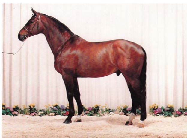
Slika 4: Danski konj (Honey ..., 2011)

So elegantni in močni konji. Uporablja se jih za vleko težkih kočij in jahanje. Iz te pasme je izhajal začetnik linije Pluto (Lipizzaner, 1997). Na sliki 4 je prikazan žrebec pasme danski konj.