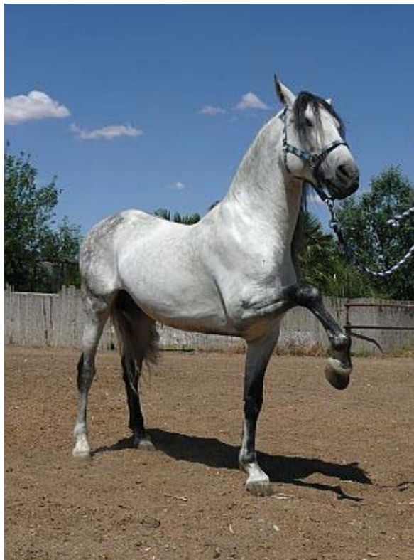
Slika 1: Španski konj (Our horses ..., 2009)

V času, ko je nastajal lipicanec, je bil španski konj zelo cenjen zaradi ponosne drže in plemenite zunanosti. S tem je bil na prvem mestu med evropskimi pasmami konj. To je bil vzrok, da so junija 1580 uvozili v Lipico tri španske žrebce in v naslednjem letu še 6 plemenskih žrebcev in 24 kobil ter s tem prenesli plemenito kri na kraškega konja (Peternel, 2009). Ta pasma je prispevala lipicancu dve liniji, Maestoso in Favory. Na sliki 1 je prikazan žrebec pasme španski konj. Španske konje je uporabljala tudi kobilarne Kladruby na Češkem pri ustvarjanju svoje pasme (slika 2). Žrebca Maestoso in Favory sta prišla v Lipico iz kobilarne Kladruby.