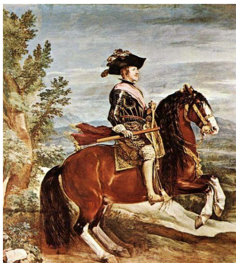
Slika 5: Baročni konj (Equestrian ..., 2011)