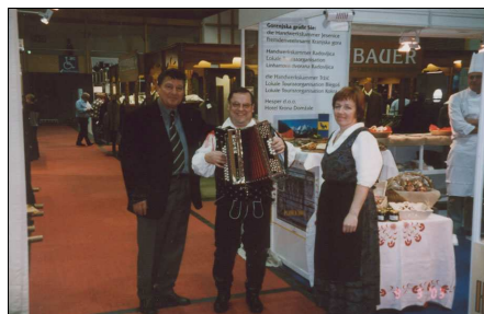
Slika 3: Utrinki s prireditvev (Pr' Katr' ..., 2006)

Trgovinica nudi: črn kruh iz kmečke peči, potico (orehovo, pehtranovo, makovo), domače piškote, suhe jabolčne in hruškove krljice, med, kravje, kozje in ovčje sire, marmelade v ličnih embalažah, domače sokove, domača žganja, kot npr. sadjevec, orehov liker, borovničev liker, žganje s suhim sadjem, viljamovko, medeno žganje, vezenine, lončene, kovane izdelke, lesene sklede, pletene izdelke iz domače ovčje volne, itd.