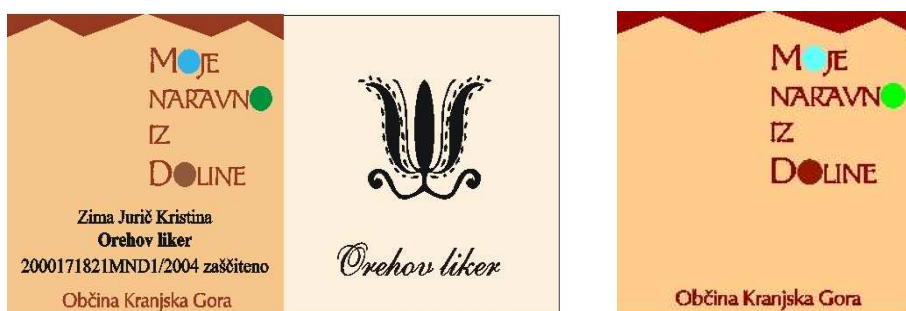
Slika 5: Blagovna znamka MOJE NARAVNO IZ DOLINE (Pravilnik ..., 2000)