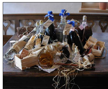
Slika 4: Pogled k dobrotam ter izdelkom domače obrti naše "Katre" (Pr' Katr' ..., 2006)