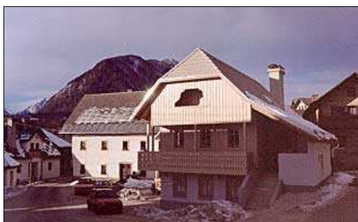
Slika 1: Obnovljena hiša Pr' Katr' (Pr' Katr' ..., 2006)

Del pravljичnega vzdušja je bil že večkrat predstavljen tudi v Cankarjevem domu v Ljubljani, in sicer ob zaključku letnih aktivnosti EKO šol v Sloveniji.