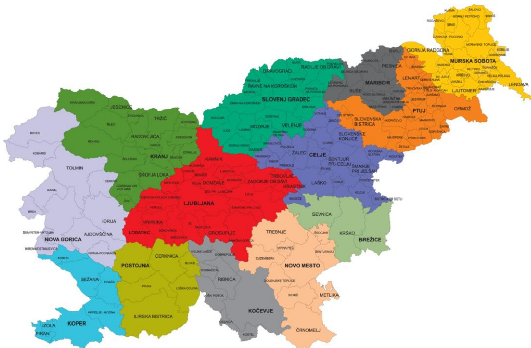
Slika 1: Območne enote in izpostave območnih enot KGZS (KGZS, 2008a)